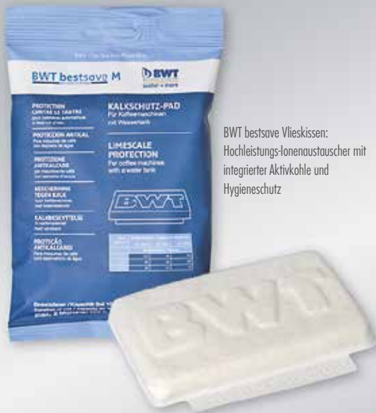
BWT bestsave Vlieskissen: Hochleistungs-Ionenaustauscher mit integrierter Aktivkohle und Hygieneschutz