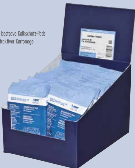
BWT bestsave Kalkschutz-Pads in attraktiver Kartonage